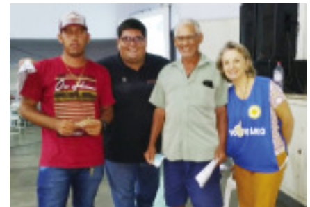
Três ganhadores dividiram o Prêmio de 500 reais e doaram 50 reais ao SOS

Os recursos captados serão muito bem aplicados em seis projetos realizados no SOS com crianças, adolescentes, jovens, adultos e muitas famílias em vulnerabilidade social da cidade. Na próxima semana, será publicado o balancete completo, contabilizando as entradas, despesas e saldo líquido.