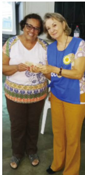
A ganhadora do prêmio de 500 reais também doou 50 reais a Instituição

Os recursos captados serão muito bem aplicados em seis projetos realizados no SOS com crianças, adolescentes, jovens, adultos e muitas famílias em vulnerabilidade social da cidade. Na próxima semana, será publicado o balancete completo, contabilizando as entradas, despesas e saldo líquido.